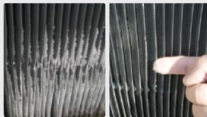
Grilles des tours de refroidissement