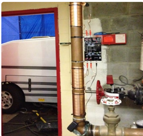
Vulcan S25 installé chez Ice Land dans le New Jersey, USA