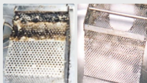
Séparateurs de graisses