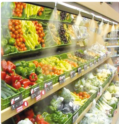
Brumisateurs dans les rayons alimentaires