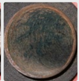
Biofilm présent sur un tuyau