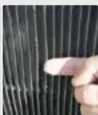
Grilles des tours de refroidissement