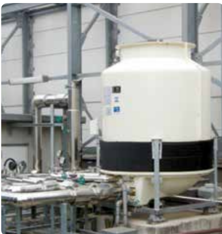
Tour de refroidissement