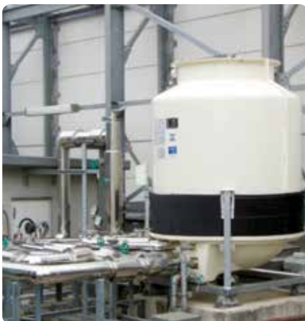
Tour de refroidissement