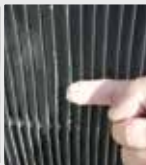
Grilles des tours de refroidissement